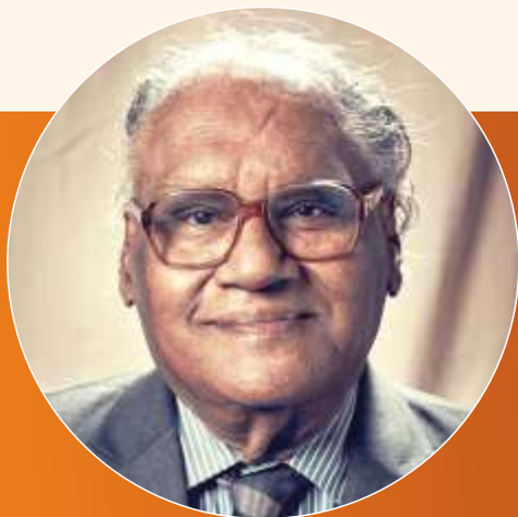
Dr. CNR Rao, FRS 2016