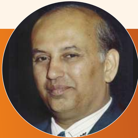
Dr. UR Rao, FRS 2017